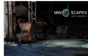
Εξέλιξη του project 1

Εμπειρία 4D (θερμοκρασία, ατμοί, μυρωδιές)