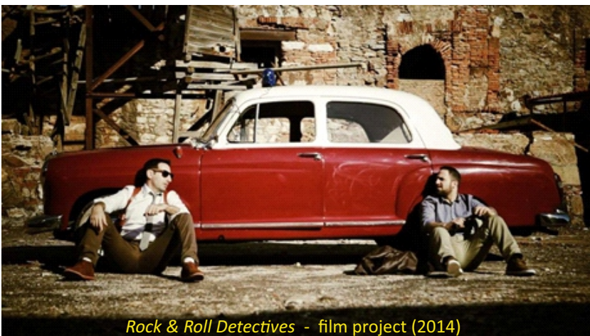
Rock & Roll Detectives - film project (2014)