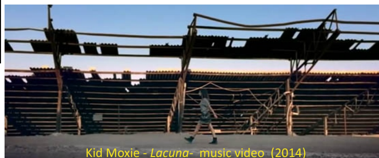
Kid Moxie - Lacuna- music video (2014)