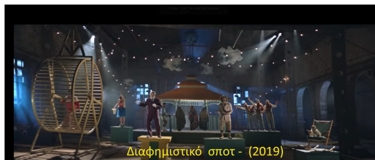
Διαφημιστικό σποτ - (2019)

Το κινηματογραφικό πλατώ συνιστά μια από τις πολλές διαστάσεις της φυσιολογίας του ΤΠΠΛ. Αποτελεί μια σταθερή γέφυρα ανάμεσα στις βασικές δραστηριότητες του Πάρκου και τον κόσμο της καλλιτεχνικής δημιουργίας, στην πιο σύγχρονη μορφή της, που συνδυάζει τον πολιτισμό με την τεχνολογία.