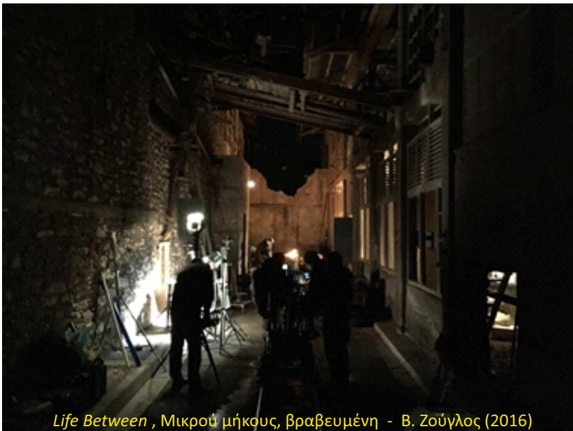
Life Between , Μικρού μήκους, βραβευμένη - Β. Ζούγλος (2016)