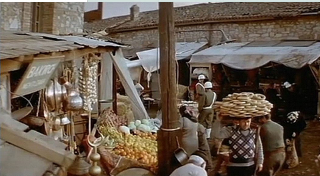
Η ΠΟΛΙΤΙΚΗ Κουζίνα στο Συγκρότημα Αρσενικού του ΤΠΠΛ